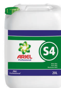
ARIEL PROFESSIONAL S4 BLANC MAX