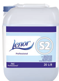
LENOR PROFESSIONAL S2 ADOUCISSANT