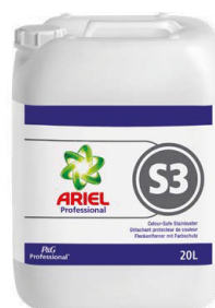
ARIEL PROFESSIONAL S3 DÉTACHANT PROTECTEUR DE COULEUR