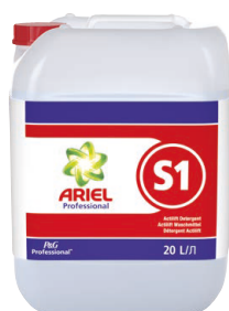
ARIEL PROFESSIONAL S1 DÉTÉRGENT ACTILIFT