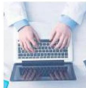
TREND Il tesoro dei big data

Considerando poi lo scenario di costante incertezza economica diventa imprescindibile per i lavoratori del futuro tenersi aperte più porte possibile, investendo sulla formazione continua (e certificata). L'incalzante evoluzione tecnologica rende infine indispensabile al lavoratore apprendere una serie di competenze interpersonali, strategie di apprendimento, competenze cognitive e le abilità nella gestione il cambiamento che possono fare la differenza. Indispensabile infine la conoscenza (meglio anche qui se certificata) della lingua inglese, mentre il tedesco costituisce un valore aggiunto particolarmente apprezzato. Arabo e cinese potrebbero infine fare la differenza in un mercato del lavoro sempre più concorrenziale e aperto su nuovi fronti.