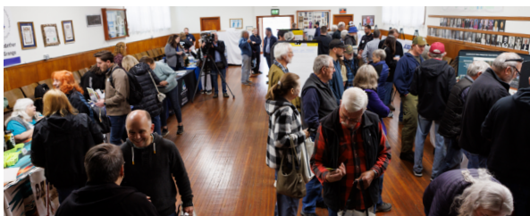
PGE y sus socios participan con la comunidad en un evento de puertas abiertas de Wildfire Ready en Estacada, Ore., en mayo de 2025.

Este enfoque coordinado nos permite entender las necesidades únicas de cada uno en cuanto a apoyo y mejorar nuestro Plan de Mitigación de Incendios Forestales. También nos permite identificar oportunidades de asociación más estrecha y prepararnos para diversas emergencias, como nuestra respuesta a los incendios forestales y las interrupciones del suministro eléctrico por motivos de seguridad pública.