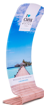
Socle de présentation Torsadé B

Longueur 91,5 cm Largeur 70,6 cm Hauteur 228 cm