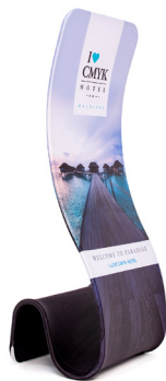
Socle de présentation Torsadé A

Les gens utilisent souvent un objet repérable de loin comme lieu de rendez-vous ou de rencontre. Et si vous attiriez votre public à vous grâce à ce socle de présentation à fermeture éclair ? Il est disponible en 4 formes : de la forme torsadée particulièrement originale à la forme en iPad. Pratique pour y glisser votre tablette et enregistrer les données de vos clients ou tout simplement réaliser vos démonstrations. Ce socle de présentation à fermeture éclair vous permet d'être repéré de loin et dans n'importe quel évènement !