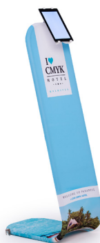
Socle de présentation affichage iPad

Longueur 40 cm Largeur 50 cm Hauteur 200 cm