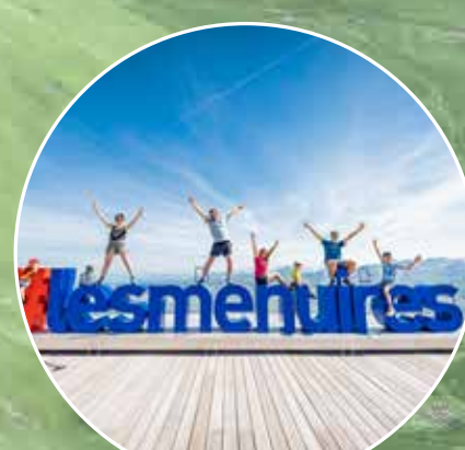
POINTE DE LA MASSE