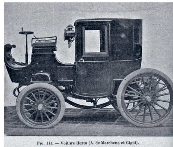
FIG. 141. — Voiture Hurlu (A. de Marchena et Gigot).

Elektrische auto's werden in Europa en Amerika al ontwikkeld rond 1890. Ze leken nog op paardenkoetsen maar dan voorzien van veel accu's en een elektromotor.