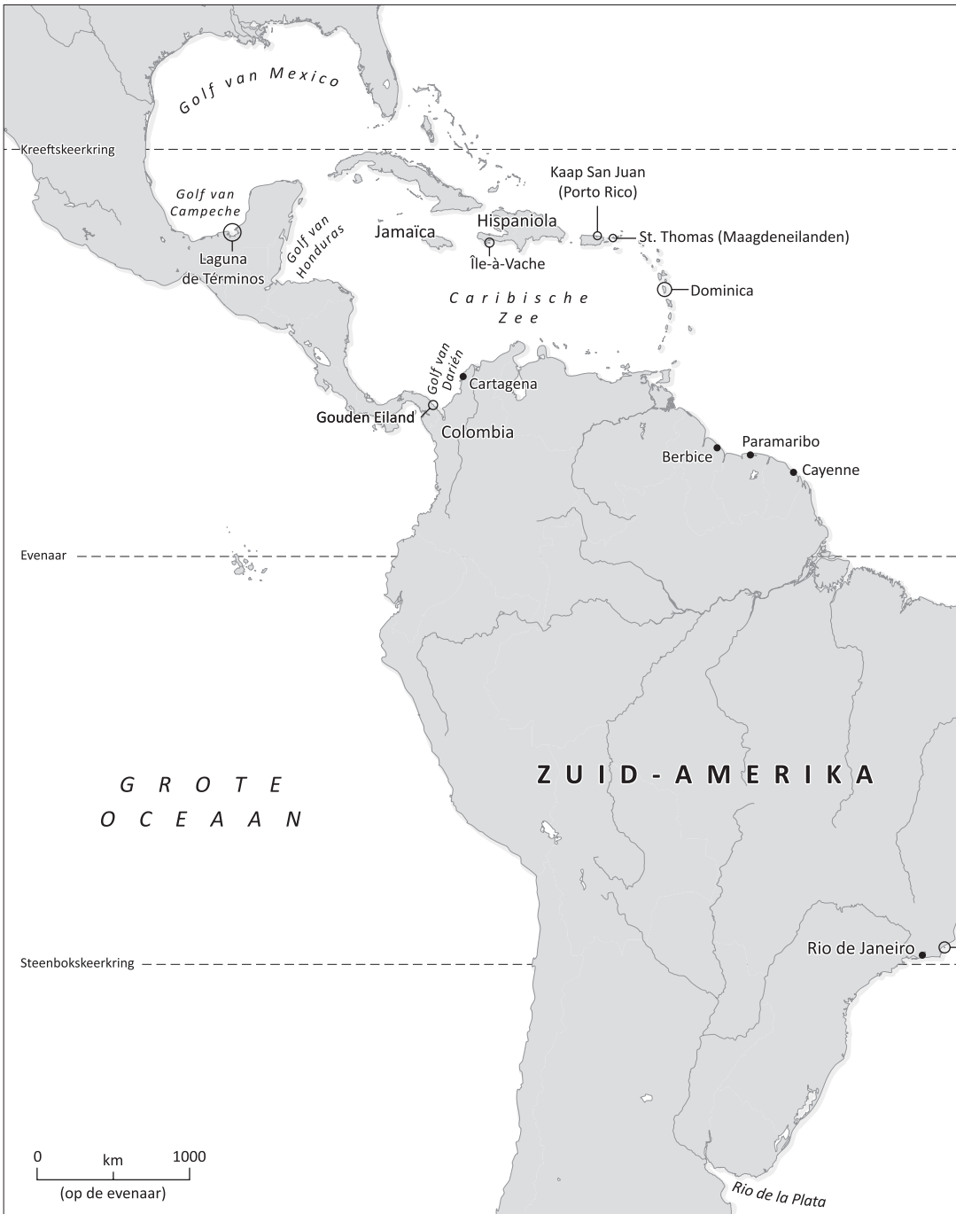
1. Kaart van de afgelegde routes van de schepen. UvA-Kaartenmakers, Castricum.