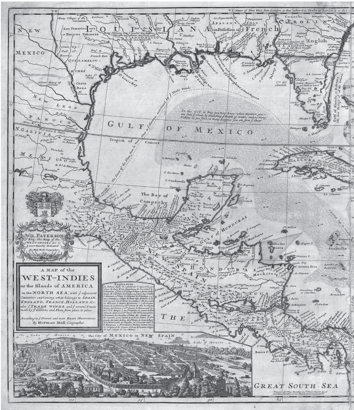
2. Kaart van West-Indië, Herman Moll, New and Complete Atlas, circa 1720.