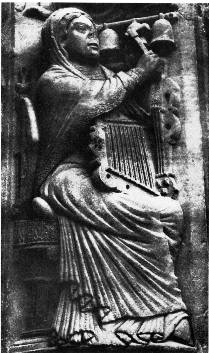
De muziek, Chartres, westportaal, 12e eeuw.