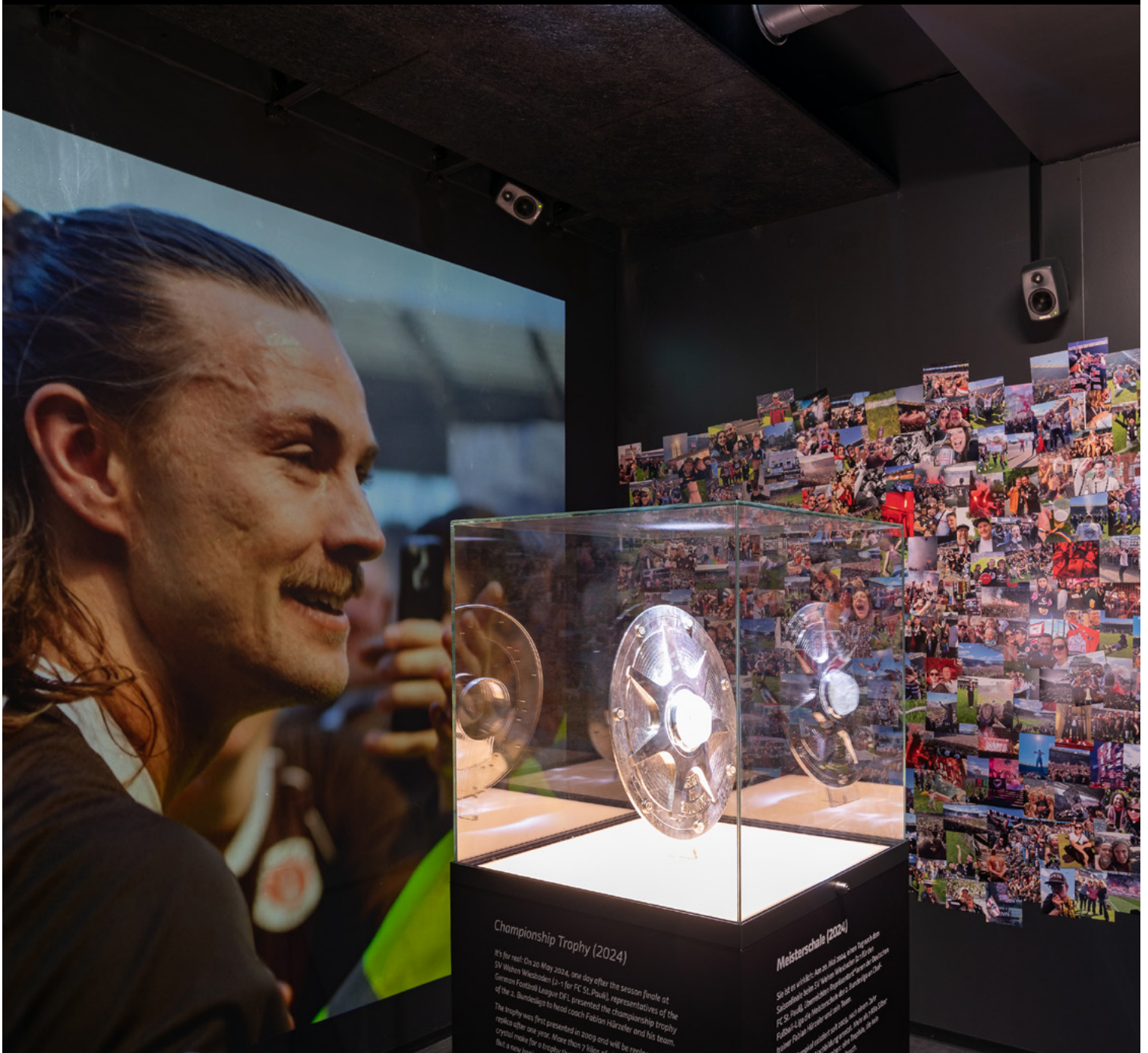
Championship Trophy (2024)

IMMERSIVER SOUND FÄNGT DAS HERZ UND DIE SEELE DES FARBENFROHEN HAMBURGER CLUBS EIN