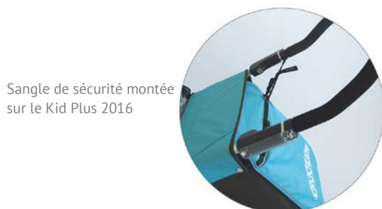
Sangle de sécurité montée sur le Kid Plus 2016

La sangle de sécurité se fixe sur le côté en formant une boucle autour du guidon. Les boucles rapides se fixent dans l'un des passants du rabat arrière prévus pour attacher un feu arrière sur accus. Cela nous permet d'exclure que le guidon ne se désolidarise de la remorque.