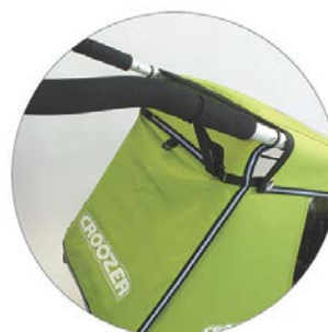
Sangle de sécurité montée sur le Kid 2016