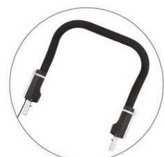
Licht- Schiebebügel 2016

Ja, auch Licht-Schiebebügel mit Click & Crooz ® Bedienung müssen mit dem zusätzlichen Sicherungsband ausgestattet werden.