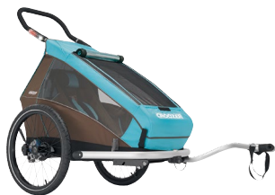
Croozer Kid Plus inkl. AirPad ® Federung und Licht 749,00 € (Einsitzer) 799,00 € (Zweisitzer)