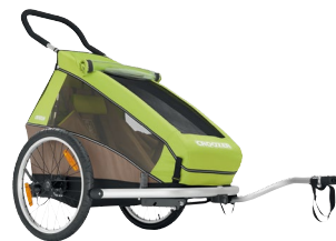
Croozer Kid 549,00 € (Einsitzer) 599,00 € (Zweisitzer)