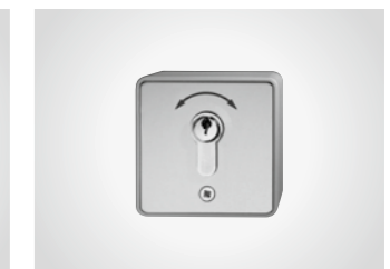
Schlüsseltaster KT 8 AP