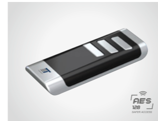
Handsender BLACK Remote

3-Kanal Handsender, 433 MHz, mit KeeLoq-Wechselcode, AES