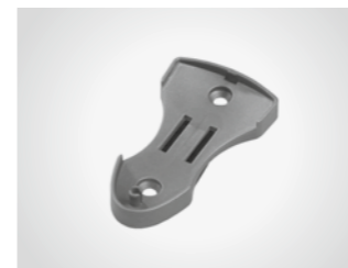
Wandhalterung für Handsender

Mit Sonnenblendclip, für MAX 43-2/-4 (1) und MIX 43-2 (2)