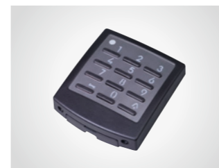
Außentaster DigiCode Premium

Metalltastatur, 433 MHz, mit KeeLoq-Wechselcode, AES