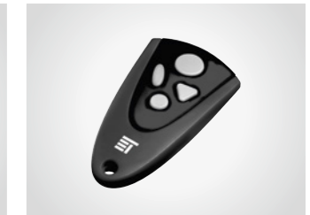
Handsender MAX 43-4

4-Kanal Handsender, 433 MHz, mit KeeLoq-Wechselcode