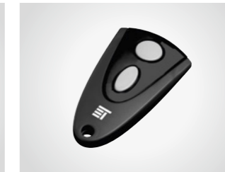
Handsender MAX 43-2

2-Kanal Handsender, 433 MHz, mit KeeLoq-Wechselcode