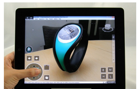
Usar controles personalizados para CAD/CAM 3D en el iPad