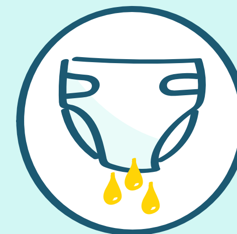
Pañal de bajo rendimiento