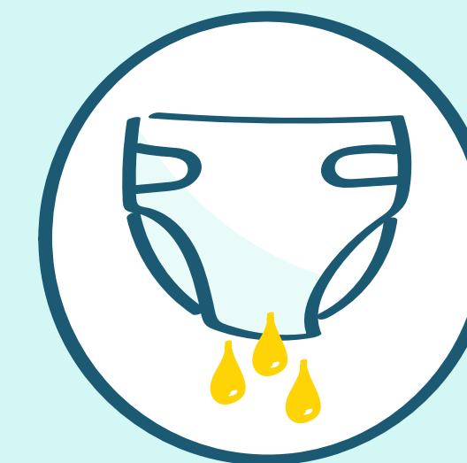
Pañal de bajo rendimiento