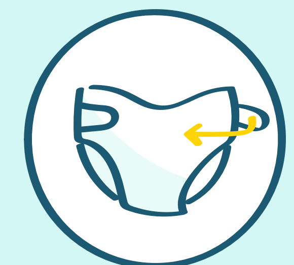
Cambio de pañales