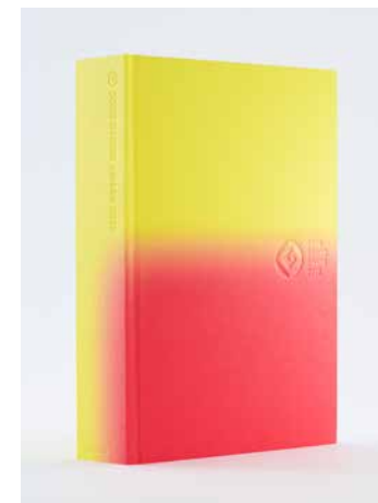
受賞年鑑 2024年3月発刊