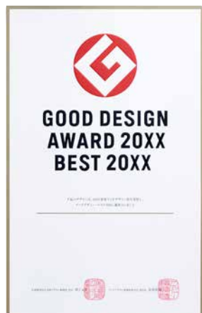
表彰状 10月中旬以降、順次送付