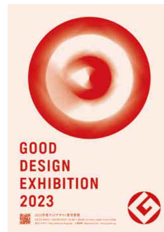
受賞展 展示キャプション等へ掲載