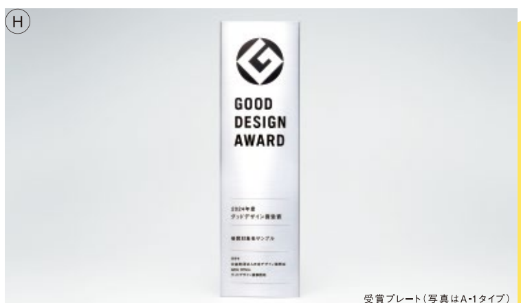
受賞プレート(写真はA-1タイプ)