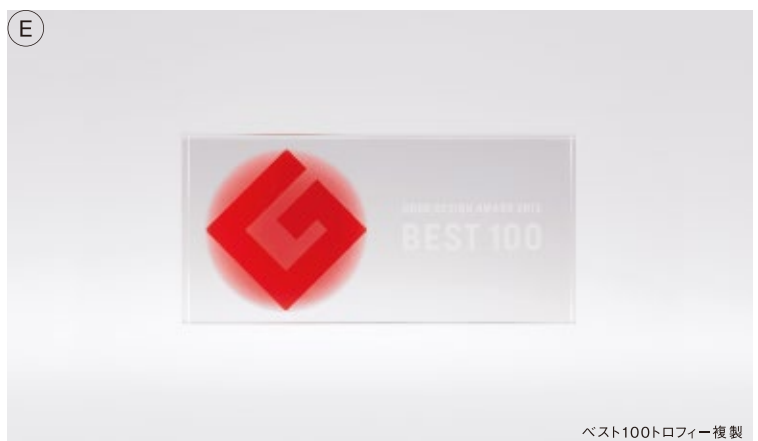
ベスト100トロフィー複製