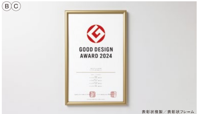
表彰状複製 / 表彰状フレーム