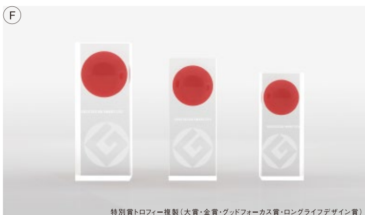
特別賞トロフィー複製(大賞・金賞・グッドフォーカス賞・ロングライフデザイン賞)