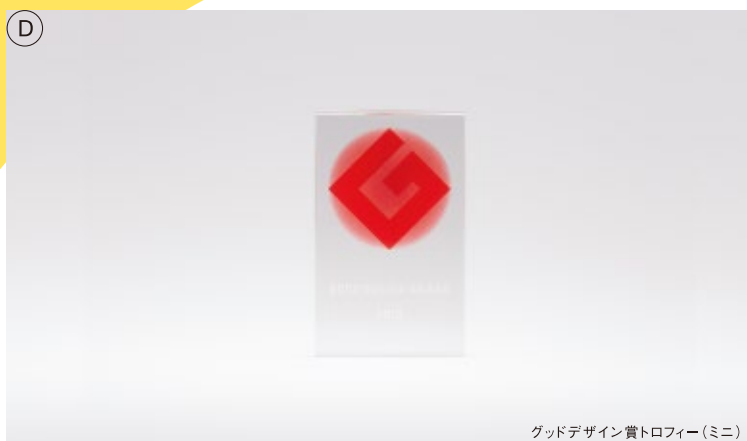
グッドデザイン賞トロフィー(ミニ)