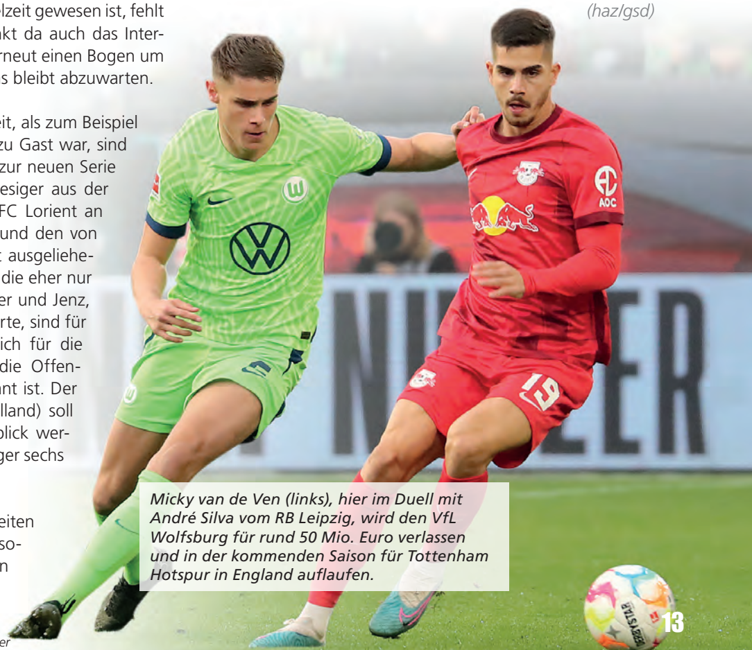
Micky van de Ven (links), hier im Duell mit André Silva vom RB Leipzig, wird den VfL Wolfsburg für rund 50 Mio. Euro verlassen und in der kommenden Saison für Tottenham Hotspur in England auflaufen.