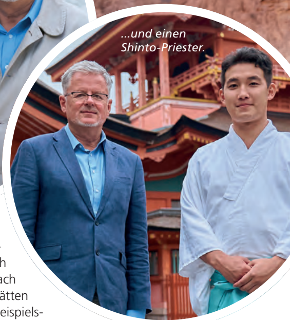
...und einen Shinto-Priester.

schen Behörde ange stellt. Es sind aber auch Menschen, die einfach nur in der Nähe der Stätten wohnen. So hat uns beispielsweise eine kleine Mayafamilie, die unweit des Palenque-Tempels lebt, von ihren religiösen Gefühlen erzählt.