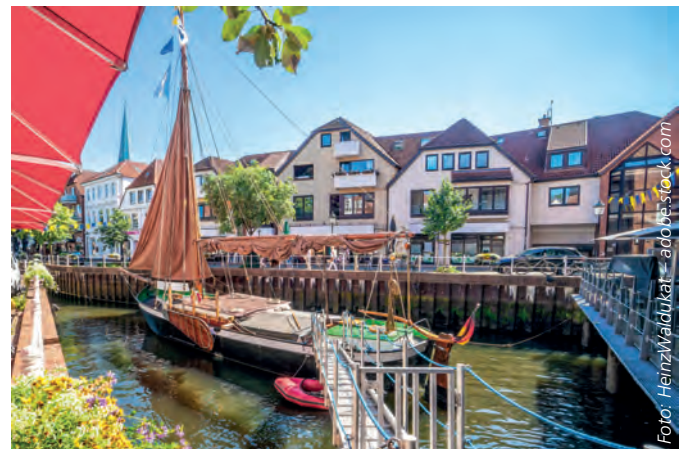
Der 125 Jahre alte Ewer „Margareta“ liegt in Altstadt im Fleth. Er ist das letzte erhaltene Schiff der Buxtehuder Flotte.

1840 veröffentlichte Schriftsteller und Verleger Wilhelm Schröder das Märchen „Der Hase und der Igel“ erstmalig auf Plattdeutsch im Hannoverschen Volksblatt unter dem Titel „Dat Wettlopen twischen den Hasen und den Swinegel up de lütje