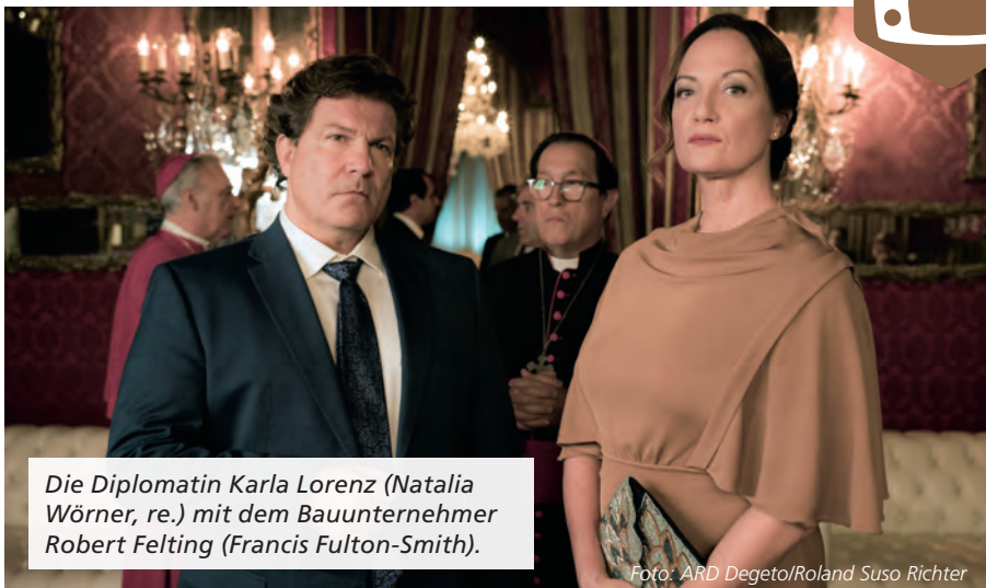
Die Diplomatin Karla Lorenz (Natalia Wörner, re.) mit dem Bauunternehmer Robert Felting (Francis Fulton-Smith).

Die Diplomatin Karla Lorenz wird Botschafterin in der „Ewigen Stadt“ Rom. Kaum ist sie im Dienst, stürmen aktivistische Geiselnnehmer ein Theater. Auch ein Botschaftsmitarbeiter ist in ihrer Gewalt. Die bislang unbekannte Gruppe fordert Schadensersatz für die Todesopfer eines Hauseinsturzes. Allein auf die römische Chefermittlerin Motte möchte sich Karla nicht verlassen. Sie stellt eigene Ermittlungen an.