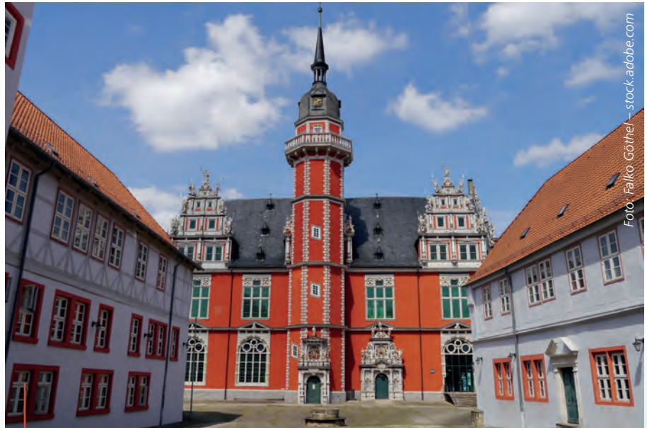
Das Juleum in Helmstedt war viele Jahre das Zentrum der Wissenschaften.

Dies sind nur einige wenige der Denkmäler, die Niedersachsen zu bieten hat. LOTTO Niedersachsen hilft über die Lotterie