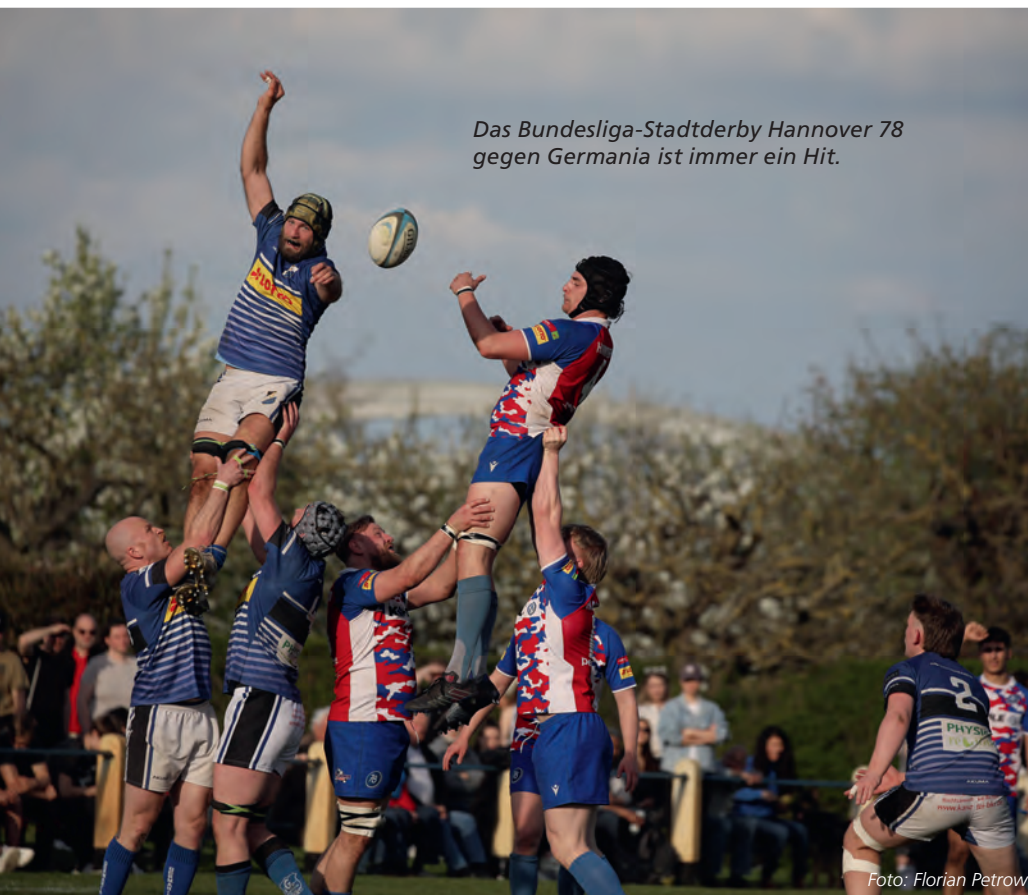
Das Bundesliga-Stadtderby Hannover 78 gegen Germania ist immer ein Hit.

So kamen sogar Überlegungen auf, einen Spielbetrieb ohne den Dachverband zu organisieren. Nicht nur die Klubs im Nord-Osten stimmten sich untereinander ab, sondern auch gemeinsam mit den seit Jahren stärkeren Südklubs, die seit fast 20 Jahren den deutschen Meister stellen. Am Ende wurden Konfrontation und Eskalation vermieden. 78 und Germania erhielten eine Geldstrafe von 500 Euro, Victoria geht mit fünf Punkten Abzug in die neue Saison.