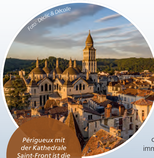
Périgueux mit der Kathedrale Saint-Front ist die Hauptstadt des Départements.

An der wachsenden touristischen Begeisterung für die Dordogne ist Bruno nicht ganz unschuldig. Allein in Deutschland haben die inzwischen 16 Romane mit dem Dorfpolizisten rund 3,5 Millionen Leserinnen und Leser unterhalten. Viele davon sind auf Brunos Spuren unterwegs – zur Verwunderung der Französinen und Franzosen, denen die Bestseller von Martin Walker nahezu unbekannt sind.