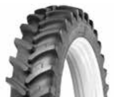
Michelin Agribib RC