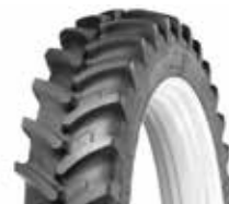
Michelin Agribib RC