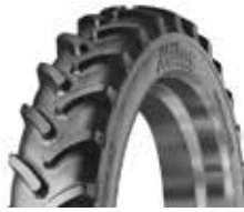
Mitas AC95 RC