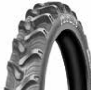
Taurus Soil RC95