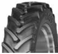
Mitas AC85 RC