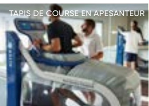
TAPIS DE COURSE EN APESANTEUR