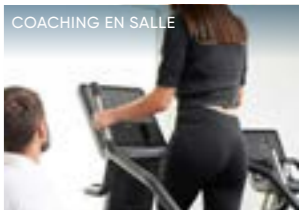
COACHING EN SALLE