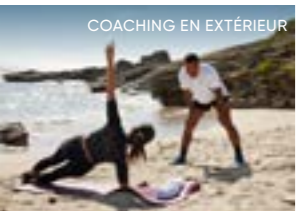
COACHING EN EXTÉRIEUR