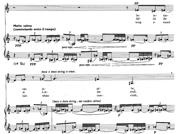
Przykład 6. G. Kurtág, Bornemissza Péter mondásai op. 7, część III. © Copyright by Universal Music Publishing Editio Musica Budapest. Reproduced by permission.