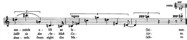
Przykład 5. G. Kurtág, Bornemissza Péter mondásai op. 7, część II „Grzech”. © Copyright by Universal Music Publishing Editio Musica Budapest. Reproduced by permission.