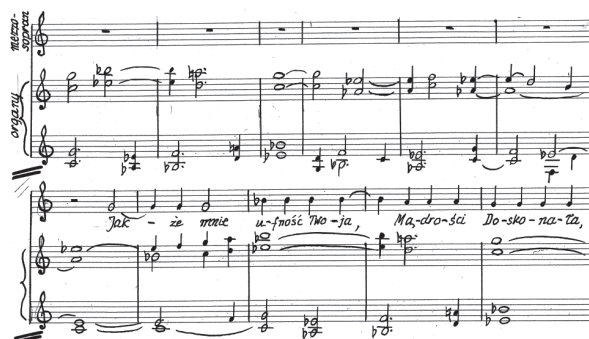
Przykład 1. A. Nikodemowicz, Tryptyk – Grudki kadzidła IV , cz. I, t. 1–11. Fragment rękopisu zamieszczony dzięki uprzejmości rodziny kompozytora.

Cykl otwiera wiersz o incipicie Jakże mnie ufność Twoja... Podmiot, mimo odczuwania sprzecznych emocji, okazuje wiarę w plan Boży i nadzieję na zbawienie. Zanim wybrzmia jego pierwsze słowa, słyszalny jest motyw czołowy zbudowany z następstwa wstępującej tercji małej i opadającej sekundy małej. Motyw ten opracowany jest w układzie czterogłosowym nawiązującym pochodami równoległych kwint do organum (por. Przykład 1).