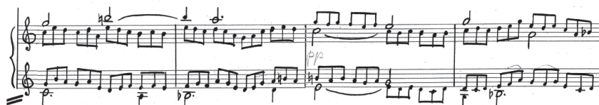
Przykład 10. A. Nikodemowicz, Tryptyk – Grudki kadzidła IV , cz. III, t. 9–12, partia organów. Fragment rękopisu zamieszczony dzięki uprzejmości rodziny kompozytora.