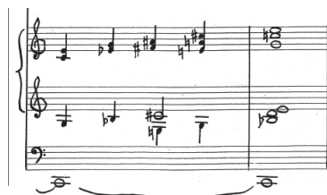
Przykład 12. A. Nikodemowicz, Tryptyk – Grudki kadzidła IV , cz. III, t. 24–25. Fragment rękopisu zamieszczony dzięki uprzejmości rodziny kompozytora.

to, że materiał brzmieniowy wydaje się słuchaczowi bardziej rozświetlony, skontrastowany z tajemniczym nastrojem pieśni otwierającej cykl. Dopiero coda wykorzystuje skalę chromatyczną i zmierza do zakończenia pieśni wyraźnym (podkreślonym nutą pedałową) akordem C-dur septymowo–nonowym (por. Przykład 12).