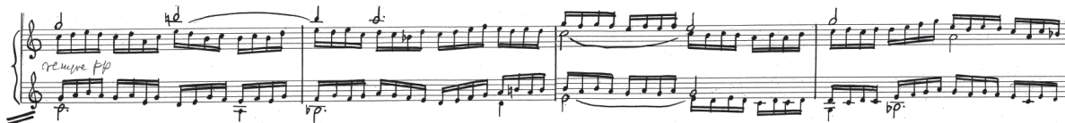
Przykład 11. A. Nikodemowicz, Tryptyk – Grudki kadzidła IV , cz. III, t. 17–20, partia organów. Fragment rękopisu zamieszczony dzięki uprzejmości rodziny kompozytora.

Przywołanie narracji części pierwszej w zmienionej formule trwa w krótkiej części A1 odpowiadającej słowom A kadzidło, co przed Tobą się zwęglą . Po niej wykorzystany jest znany z części pierwszej schemat harmoniczny z zagęszczeniem faktury organowej. Części D i D1 pieśni A kadzidło... opracowane zostały z wykorzystaniem czterogłosowego akompaniamentu, w którym kompozytor dwa głosy opracował w oparciu o wartości długonutowe, a pozostałe dwa figuracyjnie (w części D głosy figuracyjne prowadzone są triolami ósemkowymi, w D1 – szesnastkami). Głosy bardziej ruchliwe poruszają się w interwałach kwarty, kwinty, septymy i seksty w ruchu równoległym i przeciwrównoległym. To kolejne nawiązanie do prostej pod względem ruchu głosów techniki polifonicznej, która ugruntowuje w słuchaczu poczucie związku z początkami polifonii w muzyce europejskiej, a także zabieg o charakterze ilustracyjnym (por. Przykłady 10 i 11).