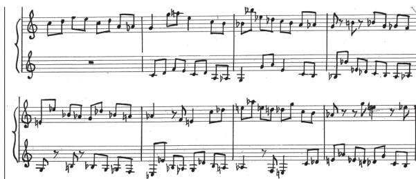
Przykład 6. A. Nikodemowicz, Tryptyk – Grudki kadzidła IV , cz. II, t. 1–8, partia organów. Fragment rękopisu zamieszczony dzięki uprzejmości rodziny kompozytora.

Zgodnie z założeniem tryptyku ogniwo środkowe – Posyp nam serca miłością – kontrastuje z otwierającą tryptyk pieśnią. Już sam incipit tego utworu świadczy o tym, że w centrum tryptyku umieszczona została modlitwa, co sugeruje odbiorcy jej kluczową rolę w życiu człowieka. Wspomniany kontrast jest dla słuchacza czytelny już od pierwszego taktu. W partii organów wprowadzony zostaje bowiem temat, który następnie, z opóźnieniem jednego taktu, jest w interwale oktawy imitowany przez drugi z akompaniujących głosów (por. Przykład 6).