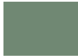
S 072 ZP GREEN