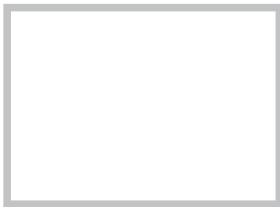
S 070 ZP WHITE