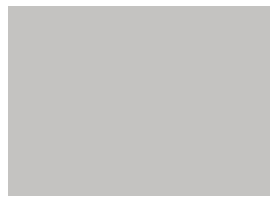
S 074 ZP LIGHT GREY