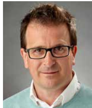
DI Jürgen Srienz Anwendungstechnik Flachdach