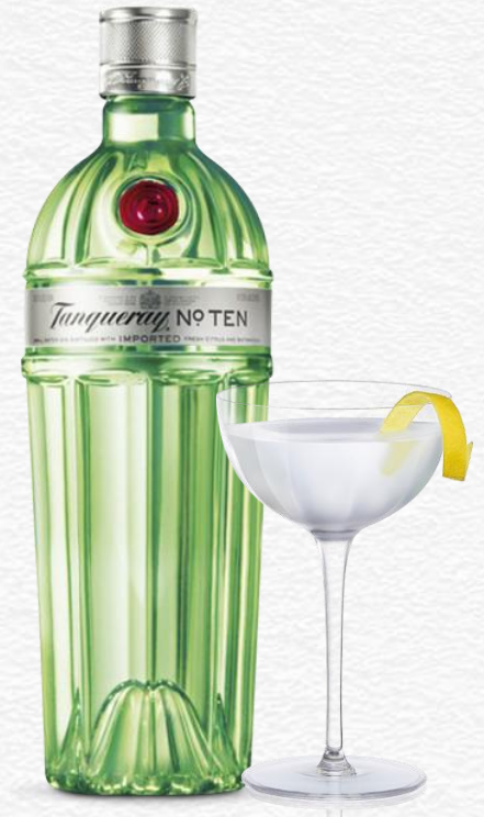
Martini No. Ten