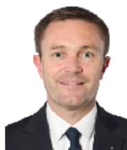
M. David LAPPARTIENT (FRA)