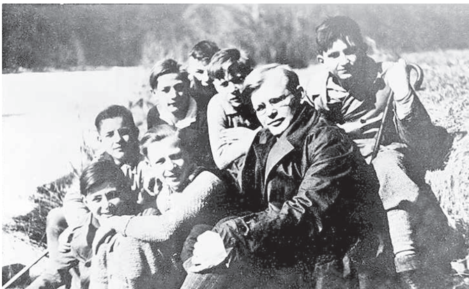
Dietrich Bonhoeffer se svými žáky (1932)

Bonhoeffer vnímal, že teologie lidské slávy, která prosákla v jeho době z nacistické ideologie do církve, je smrtelným je-