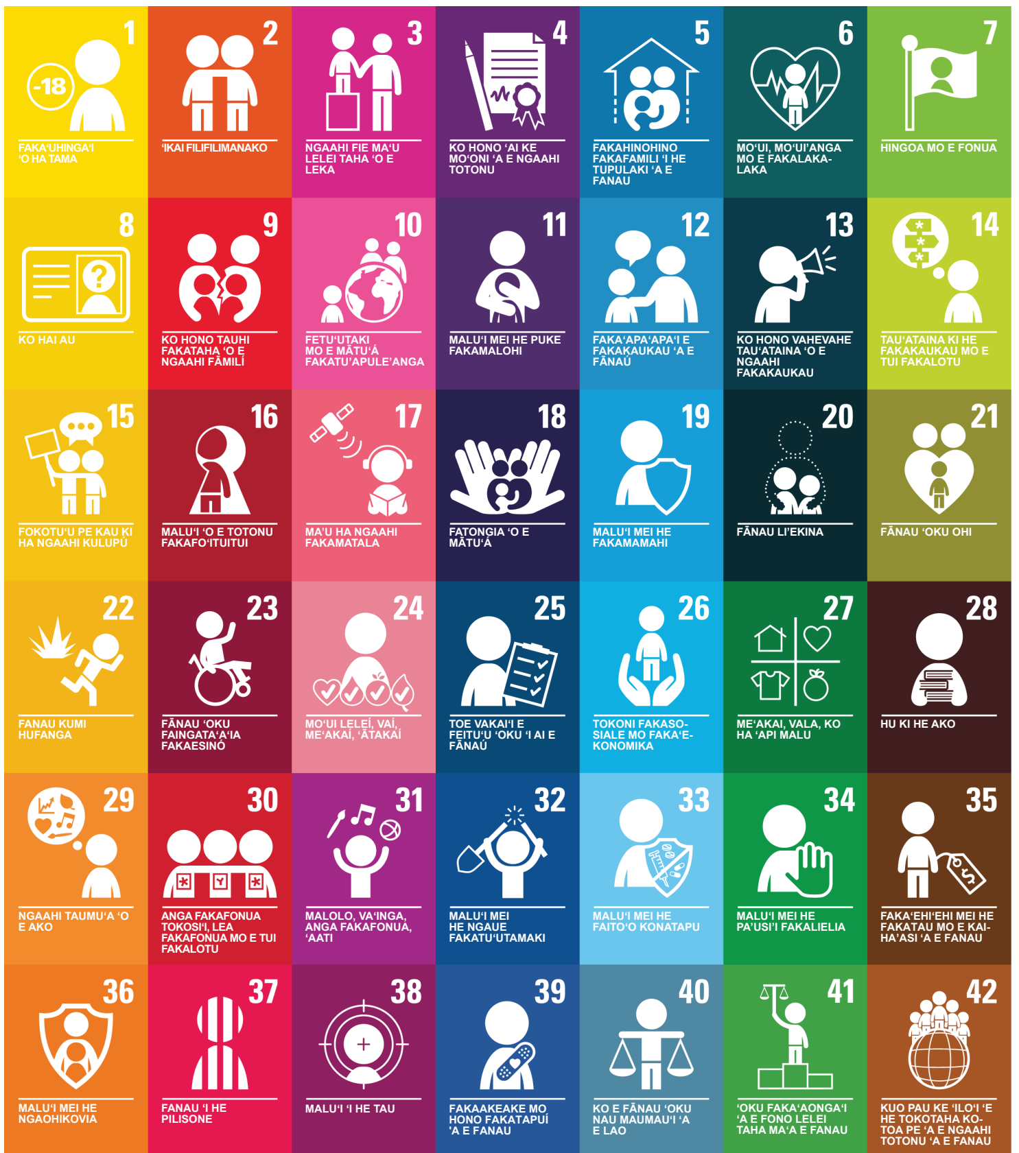
1 FAKA'UHINGA'I 'O HA TAMA