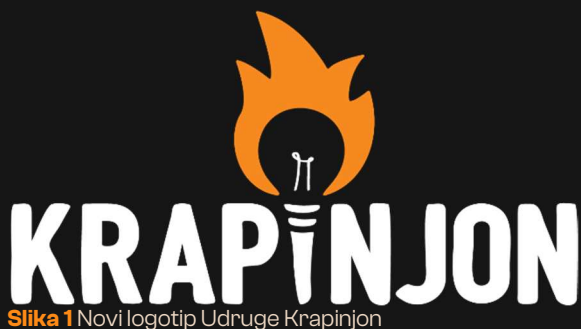
Slika 1 Novi logotip Udruge Krapinjon

Konačno, ideju Udruge saželi smo u jednostavan slogan s važnom porukom: " Zapali svoju vatru ". Ovaj je slogan poziv svim članovima i volonterima Udruge Krapinjon, ali i mladima općenito, da pronađu i njeguju ono što vole i što ih pokreće – svoju vatru.