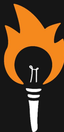
Slika 2 Redizajnirana baklja