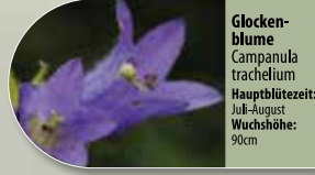
Glockenblume Campanula trachelium Hauptblütezeit: Juli-August Wuchshöhe: 90cm