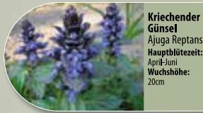
Kriechender Günsel Ajuga reptans Hauptblütezeit: März-Mai Wuchshöhe: 20cm