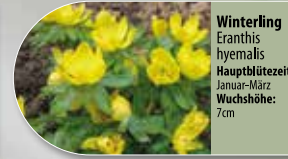
Winterling Eranthis hyemalis Hauptblütezeit: Januar-März Wuchshöhe: 7cm