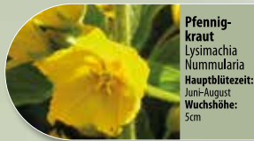
Pfennigkraut Lysimachia nummularia Hauptblütezeit: Juni-August Wuchshöhe: 5cm