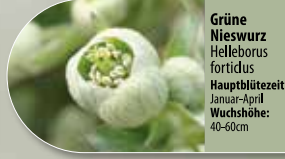
Grüne Nieswurz Helleborus fortidus Hauptblütezeit: Januar-April Wuchshöhe: 40-60cm