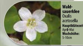
Wald-sauerklee Oxalis acetosella Hauptblütezeit: April-Mai Wuchshöhe: 5-10cm