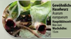
Gewöhnliche Haselwurz Asarum europaeum Hauptblütezeit: Mai-Juni Wuchshöhe: 15cm