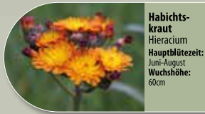
Habichtskraut Hieracium Hauptblütezeit: Juni-August Wuchshöhe: 60cm

Für Lieferanten von Wildpflanzen scannen Sie den QR-Code oder fragen Sie den Betreuer (Wildpflanzen sind auf dem Aschestreufeld nicht gestattet)