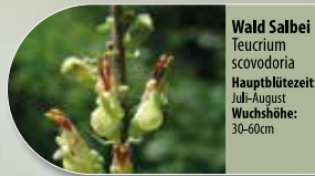
Wald Salbei Teucrium scovodoria Hauptblütezeit: Juli-August Wuchshöhe: 30-60cm