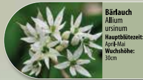
Bärlauch Allium ursinum Hauptblütezeit: April-Mai Wuchshöhe: 30cm