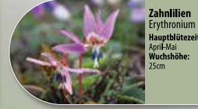
Zahnlilien Erythronium Hauptblütezeit: April-Mai Wuchshöhe: 25cm

Um das natürliche Erscheinungsbild des Waldgebiets zu schützen, dürfen keine Pflanzen aus Gartencentern und Blumen-geschäften auf die Gräber gelegt werden. Sie stören das biologische Gleichgewicht und können die biologische Vielfalt in der Natur negativ beeinflussen. Sie werden von unseren Mitarbeitern entsorgt.