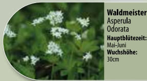
Waldmeister Asperula odorata Hauptblütezeit: Mai-Juni Wuchshöhe: 30cm