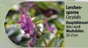
Lerchen-sporn Corydalis Hauptblütezeit: März-April Wuchshöhe: 20-25cm