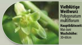
Vielblütige Weißwurz Polygonatum multiflorum Hauptblütezeit: Mai-Juni Wuchshöhe: 30-60cm