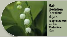
Mäi-glöckchen Convallaria majalis Hauptblütezeit: Mai-Juni Wuchshöhe: 30cm