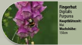
Fingerhut Digitalis purpurea Hauptblütezeit: Mai Wuchshöhe: 150cm