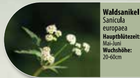
Waldsanikel Sanicula europaea Hauptblütezeit: Mai-Juni Wuchshöhe: 20-60cm