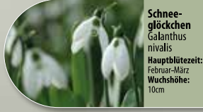
Schnee-glöckchen Galanthus nivalis Hauptblütezeit: Februar-März Wuchshöhe: 10cm