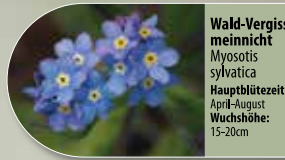
Wald-Vergissmeinnicht Myosotis sylvatica Hauptblütezeit: April-August Wuchshöhe: 15-20cm