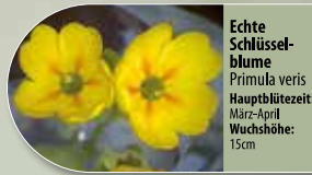
Echte Schlüsselblume Primula veris Hauptblütezeit: März-April Wuchshöhe: 15cm