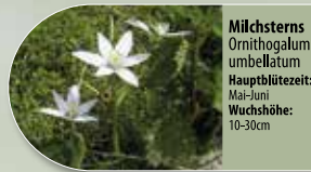
Milchstern Ornithogalum umbellatum Hauptblütezeit: Mai-Juni Wuchshöhe: 10-30cm