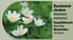
Buschwindröschen Anemone nemorosa Hauptblütezeit: März-Mai Wuchshöhe: 10-25cm