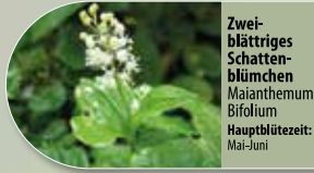
Zwei-blättriges Schattenblümchen Maianthemum bifolium Hauptblütezeit: Mai-Juni