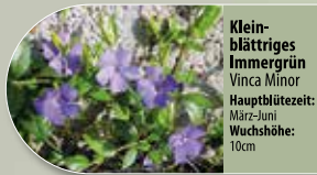
Klein-blättriges Immergrün Vinca minor Hauptblütezeit: März-Juni Wuchshöhe: 10cm