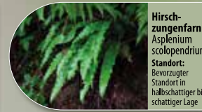
Hirschenzungenfarn Asplenium scolopendrium Standort: Bewurzelter Standort in halbschattiger bis schattiger Lage