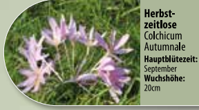
Herbstzeitlose Colchicum autumnale Hauptblütezeit: September Wuchshöhe: 20cm