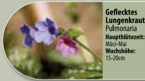
Geflecktes Lungenkraut Pulmonaria Hauptblütezeit: März-Mai Wuchshöhe: 15-20cm