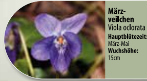
März-veilchen Viola odorata Hauptblütezeit: März-Mai Wuchshöhe: 15cm