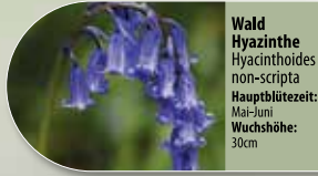
Wald Hyazinthe Hyacinthoides non-scripta Hauptblütezeit: Mai-Juni Wuchshöhe: 30cm