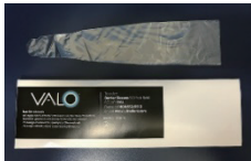
** VALO GRAND コードレスバリアスリーブ (再使用禁止)