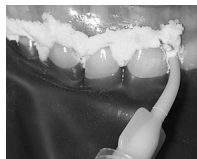
図1 ラバーダムを歯肉線に装着する前に、まず少量のオパール/コーキングを歯肉線および歯間空隙に塗布してください。

オパールーストラおよび関連製品に関する詳細は、 www.ultradent.jp にアクセスしてください。