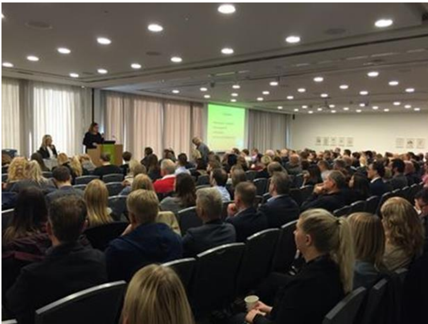
Fyrsta málstofa Persónuverndar í fundaröð um nýjar evrópskar persónuverndarreglur 2018 var haldin föstudaginn 30. september 2016 á Icelandair Hotel Reykjavík Natura. Rúmlega 300 manns sóttu málstofuna.

Hinn 27. maí 2016 barst Persónuvernd beiðni fjármála- og efnahagsráðuneytisins um skriflega umsögn um drög að viðmiðunarreglum fyrir notkun skýjalausna hjá ríkisstofnunum sem ráðuneytið fyrirhugaði að gefa út. Í erindinu var vísað til skýrslu KPMG sem ráðuneytið lét vinna um helstu eiginleika og útfærslur skýjalausna, en í henni er jafnframt að finna drög að viðmiðunarreglum fyrir notkun skýjalausna hjá hinu opinbera. Með hliðsjón af framangreindu tekur umsögn Persónuverndar bæði til skýrslunnar sjálfar, sem og draga að viðmiðunarreglunum. Umsögnin tekur til notkunar opinberra aðila á skýjalausnum til þess að vinna, varðveita eða miðla persónuupplýsingum, enda gilda lög nr. 77/2000, um persónuvernd og meðferð persónuupplýsinga, og reglur settar samkvæmt þeim, einungis um persónuupplýsingar eins og þær eru skilgreindar í 1. tölul. 1. mgr. 2. gr. laganna. Umsögnina fá finna á heimasíðu Persónuverndar .