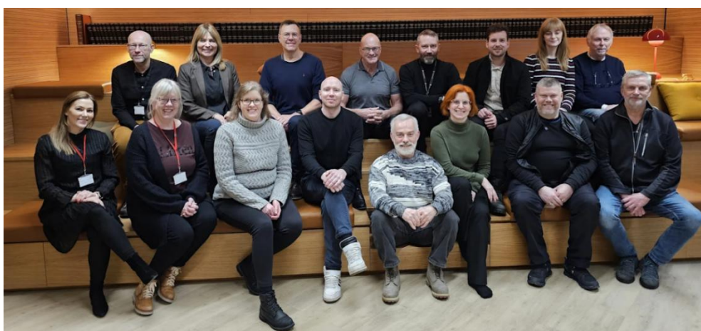
Þátttakendur á námskeiði fyrir úttektarmenn sem haldið var af Swedac.

Gæðastjóri Swedac gerði innri úttekt á gæðakerfi og ferlum ISAC í september, með aðstoð starfsfólks ISAC. Gæðakerfið hefur tekið verulegum framförum á síðastliðnu ári og uppfyllir gerðar kröfur.