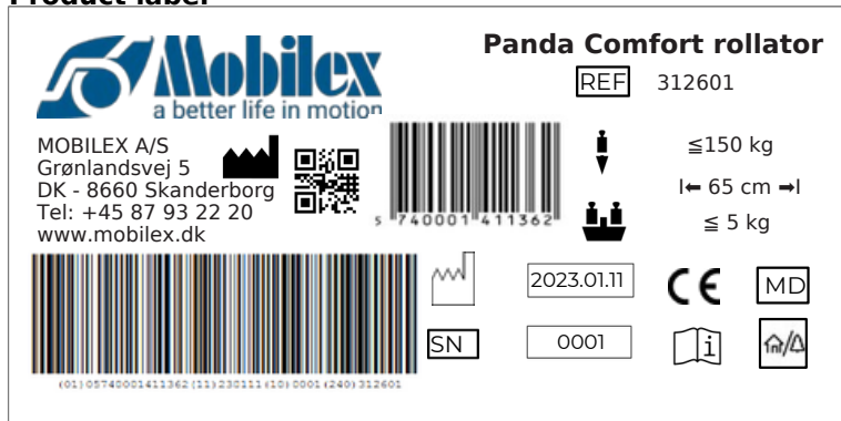
Example of the product label