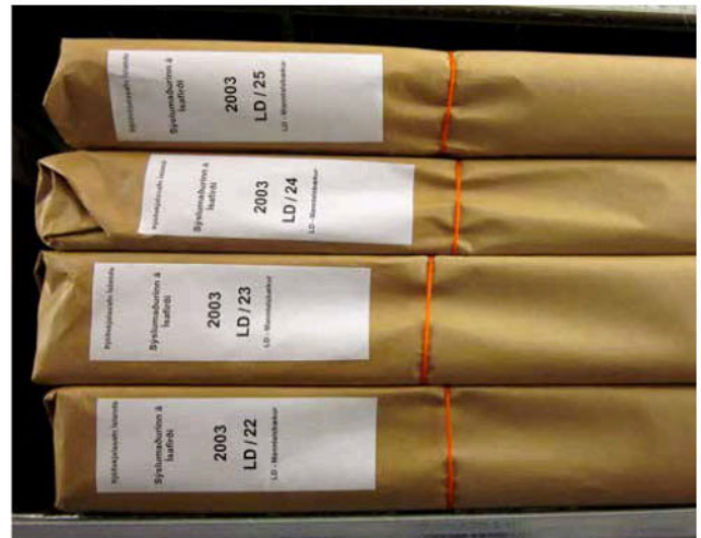
Mynd 15 – Bökkjar með umbúðapappír sem eru hnýttir með garni.

Algengt er að skjalasöfn séu flutt á milli staða á vörubrettum en það er besta leiðin til að flytja mikið magn af skjalaöskjum. Það þarf þó að gæta að ýmsu til að koma í veg fyrir að öskjurnar verði fyrir hnjaski. Þjóðskjalasafn notast við stöðluð trébretti, svokallaðar Europalettur, 800 x 1200 mm að stærð. Skjalaöskjunum er raðað á brettin réttisælis þannig að merkingar á öskjunum snúi út og er þá auðvelt að sjá hvaða skjalaöskjur liggja á brettinu. Þegar öskjunum er raðað á næstu hæð eru þær láttnar standa þvert á neðri röð til að gefa meiri stöðugleika í stæðuna. Yfirleitt er ekki staflað meira en fjórar til fimm hæðir á brettinu en ef staflað er hærra geta neðstu öskjurnar farið að gefa eftir og skemmst. Sjá mynd 16.