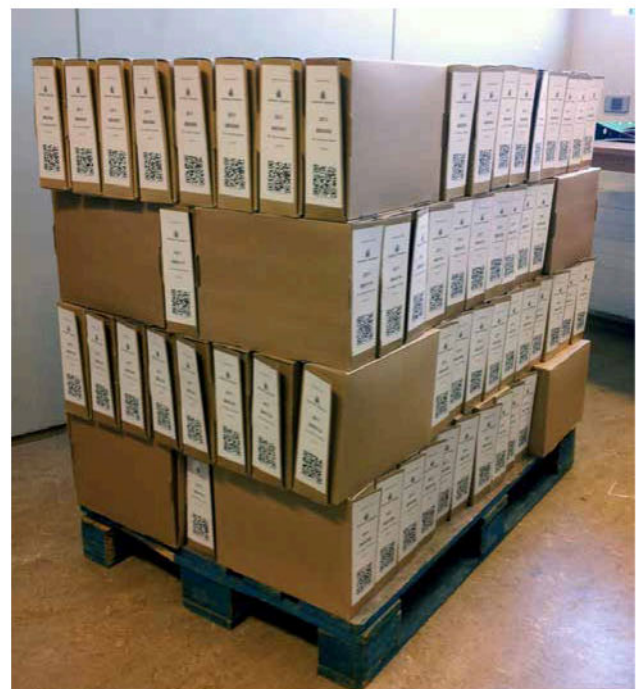
Mynd 16 – Öskjur á vörubretti.