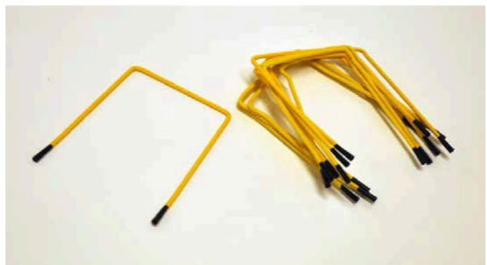
Mynd 1 - Skjalapinnar.

Nota skal sýrulausar arkir í stað skjalamappa sem einstök mál eru varðveitt í, t.d. í bréfasafni eða málafni. Starfsmenn Þjóðskjalasafns vísa á slíkar sýrulausar arkir. Arkirnar skulu merktar með hlaupandi númeri innan hvernar