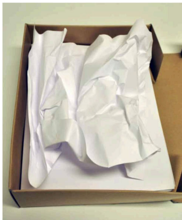
Mynd 3 – Krumpaður pappír veitir stuðning í hálffullri öskju.