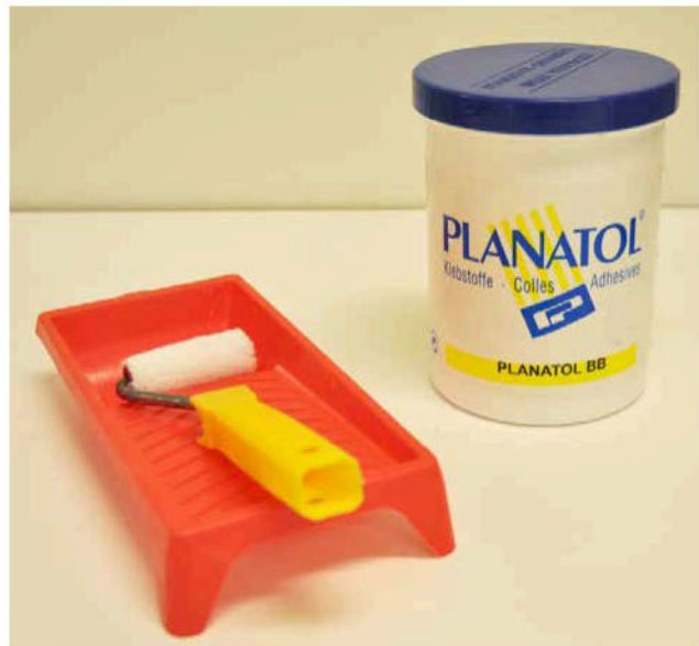
Mynd 5 – Bókbandslím, rúlla og bakki.

Starfsmaður Þjóðskjalasafns sendir miðana til afhendingarskylds aðila á rafrænu formi. Prenta skal merkimiðana á pappír sem uppfyllir ISO 9706 staðalinn og líma þá á öskjurnar með bókbandslími sem fæst m.a. á Þjóðskjalasafni Íslands. Mælt er með að bera límið á hlið öskjunnar með lítilli málningarrúllu, festa merkimiðann á öskjuna og strjúka svo yfir hann með þurri tusku eða þerriblaði til að tryggja að hann festist vel á og verði sléttur á öskjunni. Á mynd 5 má sjá bókbandslím, rúlla og bakki.