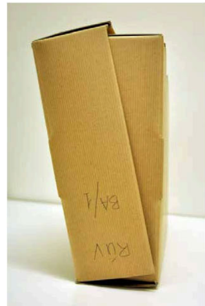
Mynd 6 – Askja getur opnast ef hún er ekki látin standa á lokinu.

Öskjur standa yfirleitt lóðrétt í hillum og skulu merkimiðarnir þá líta út eins og sést á dæmi 8. Mikilvægt er að láta öskjurnar standa á lokinu ef um er að ræða öskjur með áföstu loki. Ef þær standa ekki á lokinu er hætta á að öskjurnar opnast í hillu ef þær eru mjög troðnar af skjölum og/eða hafa ekki nægan stuðning eins og sést á mynd 6.