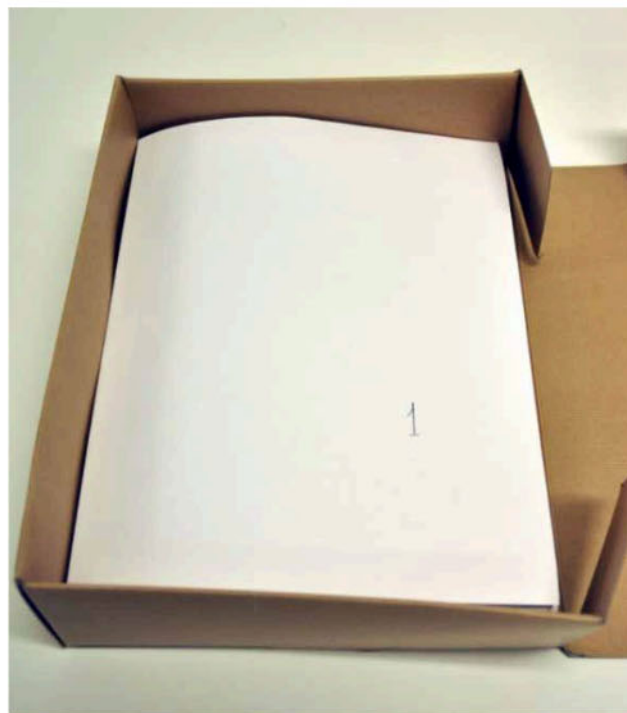
Mynd 2 – Sýrulaus örk í sýrulausri öskju.

Oft getur reynst erfitt að ganga frá bréfunum. Strax í byrjun þarf að athuga hvaða aðferð hefur verið notuð við frágang bréfa eða mála í stofnuninni. Hefur þeim t.d. verið raðað eftir sendendum/viðtakendum, eftir efni, í tímaröð eða eftir bréfa- eða málalykli? Hafa orðið breytingar á frágangi skjalanna með árunum? Ef svo er þarf það að koma skýrt fram í geymsluskrá.