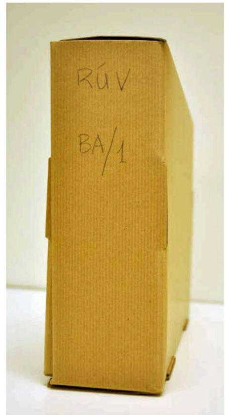
Mynd 4 – Merking á öskju með blýanti.

Starfsmenn Þjóðskjalasafns útbúa miða fyrir afhendingarskylda aðila til að merkja skjalasöfn sín, eftir að hafa fengið geymsluskrá yfir safnið til yfirlestrar, áður en þau eru afhent Þjóðskjalasafni til varanlegrar varðveislu. Sjá dæmi 8.