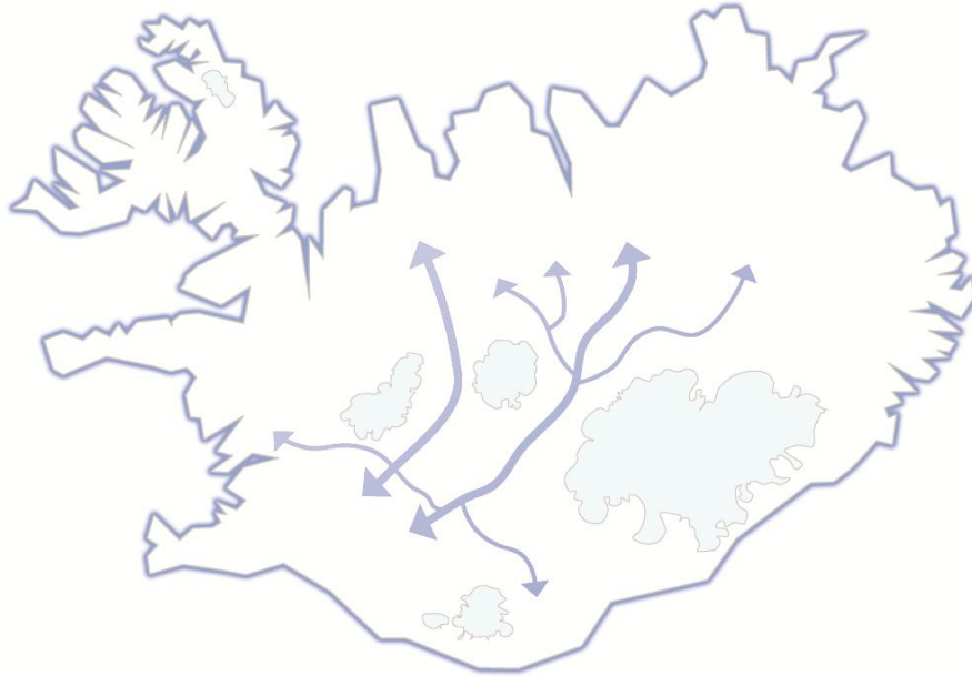
Mynd 2. Megin samgönguleiðir miðhálandisins

á milli landshluta. Stefnan um skipulag miðhálandisins er því ekki líkleg til að hafa áhrif á ferðatíma milli landshluta.