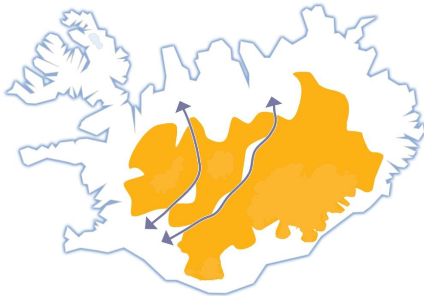
Mynd 3. Verndarheildir og mannvirkjabelti á miðhálandinu