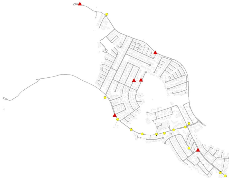
Mynd 2.2 Slys á Seltjarnarnesi árin 2012-2016. Gulir hringir eru slys með litlum meiðslum og rauðir þríhyrningar slys með alvarlegum meiðslum.

Flest slys með litlum meiðslum gerast á og við Suðurströnd. Algengasta orsök slysa með meiðslum (litlum og alvarlegum) er slæm færð, ökutæki og hjólbarðar í ólagi, og mannlegar orsakir.