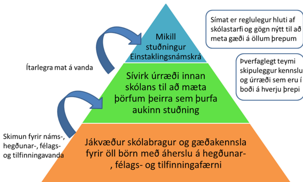
Mynd 1: Þrepaskiptur stuðningur í skólastarfi