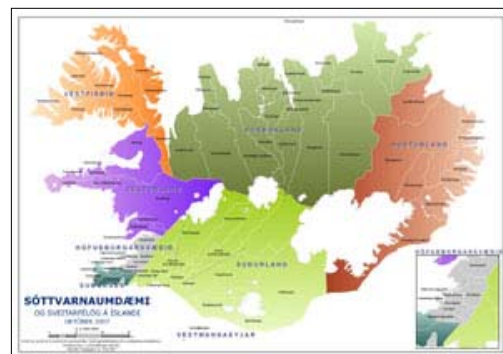
Sóttvarnaumdæmin á Íslandi Smellið á myndina til að skoða stærra kort.