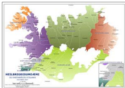
Heilbrigðisumdæmin á Íslandi Smellið á myndina til að skoða stærra kort.