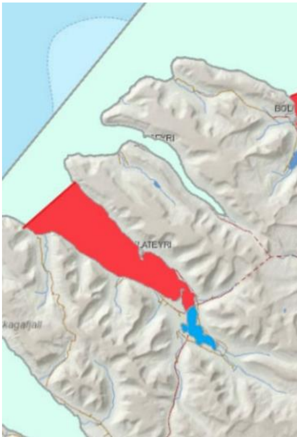
Mynd 3-1 Vatnshlot í Önundarfirði.

Enginn annar eldisaðili er með starfsemi í Önundarfirði. Ekki er því um að ræða hættu er lítur að nálægð við óskylda aðila.