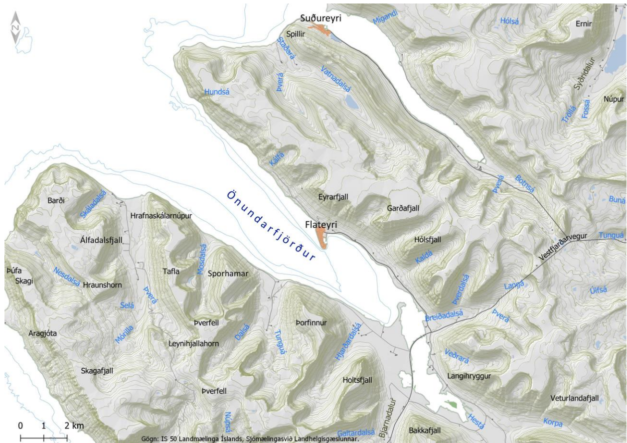
Mynd 4-1 Önundarfjörður og helstu örnefni