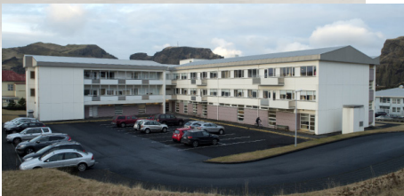
Heilbrigðisstofnun Suðurlands Vestmannaeyjum