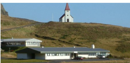
Heilbrigðisstofnun Suðurlands Vík í Mýrdal