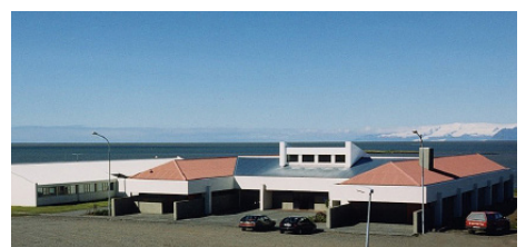
Heilbrigðisstofnun Suðurlands Höfn í Hornafirði