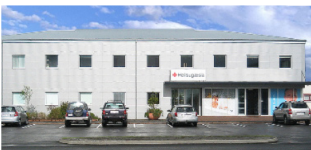
Heilbrigðisstofnun Suðurlands Hveragerði