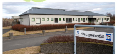
Heilbrigðisstofnun Suðurlands Laugarási