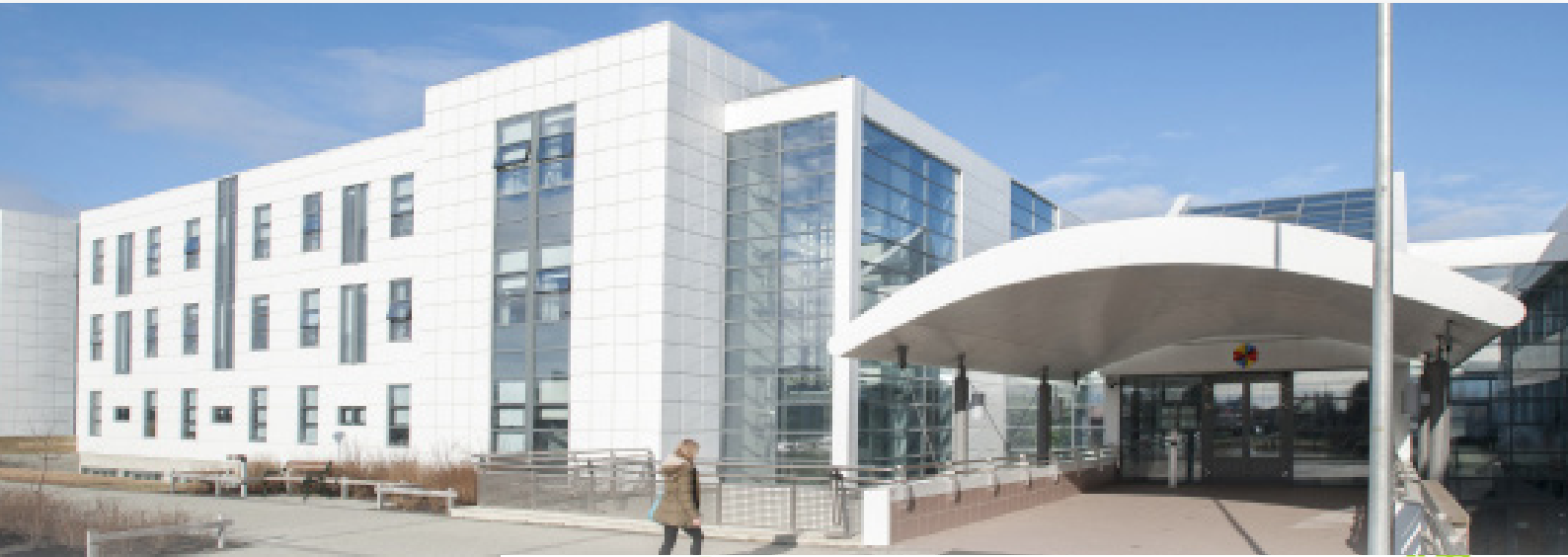
Heilbrigðisstofnun Suðurlands Selfossi