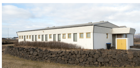
Heilbrigðisstofnun Suðurlands Þorlákshöfn