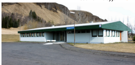
Heilbrigðisstofnun Suðurlands Kirkjubæjarklaustri