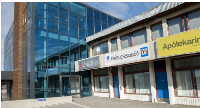
Heilbrigðisstofnun Suðurlands Rangárþingi He