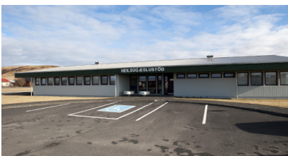
Heilbrigðisstofnun Suðurlands Rangárþingi Hv