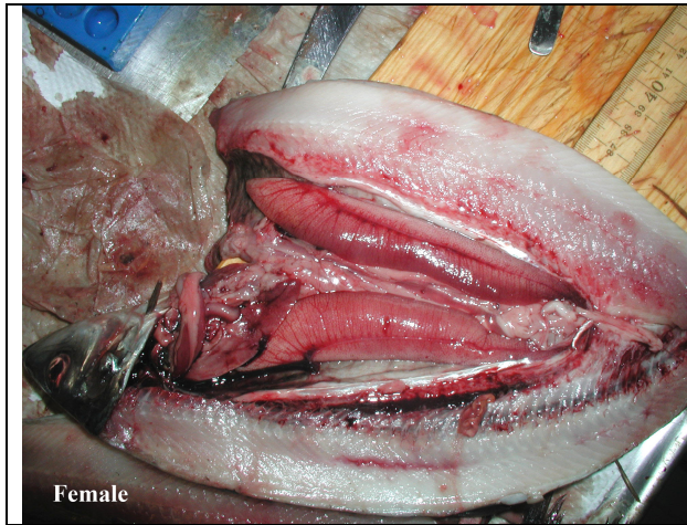
Mynd 1. Hrygna með þroskaða hrognasekki (íslensk síld frá ~maí-júlí).

Íslenska sumargotssíldin er að hrygna í júlí, með hámarki um miðjan mánuðinn. Fram að þeim tíma (frá byrjun maí) er hún með þroskaða hrognasekki (mynd 1) og svil (mynd 2).