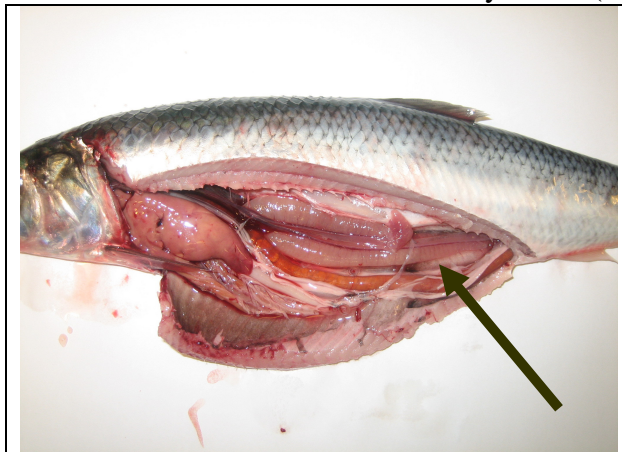
Mynd 3. Hrygna með hrygnda hrognasekki (norsk síld frá ~maí-júlí).

Norska síldin hrygnir í mars/apríl og er því mögur í byrjun sumars og með óþroskaða kynkirtla (mynd 3 og 4).