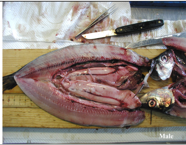
Mynd 2. Hængur með þroskuð svil (íslensk síld frá ~maí-júlí).

Norska síldin hrygnir í mars/apríl og er því mögur í byrjun sumars og með óþroskaða kynkirtla (mynd 3 og 4).